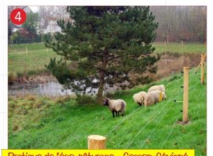
Pratique de l'écopâturage - Cesson-Sévigné