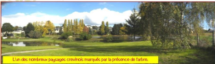
L'un des nombreux paysages crevinois marqués par la présence de l'arbre.

Haies bocagères, boisements, sujets isolés ou alignements... l'arbre est omniprésent dans le paysage crevinois et participe à la qualité de l'espace public