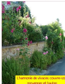
L'harmonie de vivaces couvre-sols, moyennes et hautes

Les agents du service technique peuvent apporter leurs conseils.