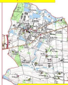
Invisibles sur le plan, un vaste réseau de petits cours d'eau à préserver.