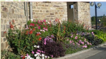
Les associations de plantes vivaces et annuelles en pleine terre prennent place dans les ambiances "prestige" du plan de gestion différenciée.

Avec les bons effets du paillage (ci-contre), ces massifs sont bien moins coûteux à entretenir.