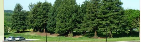
Un aménagement récent avec un double effet : - ouverture d'une vue sur le collège depuis le rond-point du Bas-Crevin - mise en valeur des troncs des séquoias

De nombreuses autres vues sont à exploiter pour la mise en valeur des espaces publics.